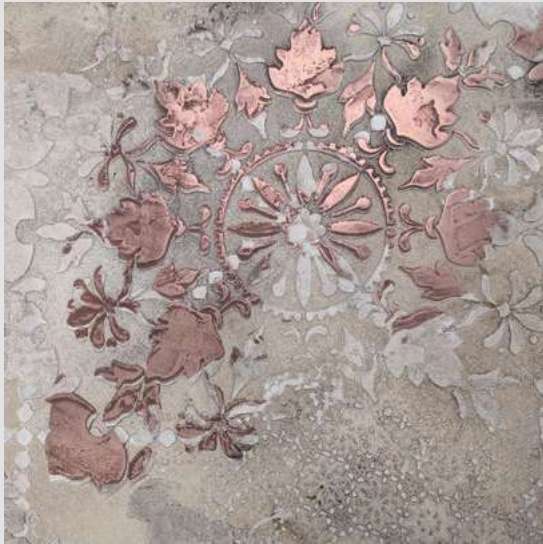
METALLO_FUSO & CALCECRUDA

Metallo_Fuso confère une élégance rare à tous les environnements. Sa combinaison avec un produit comme CalceCruda produit des effets raffinés qui embellissent les espaces.