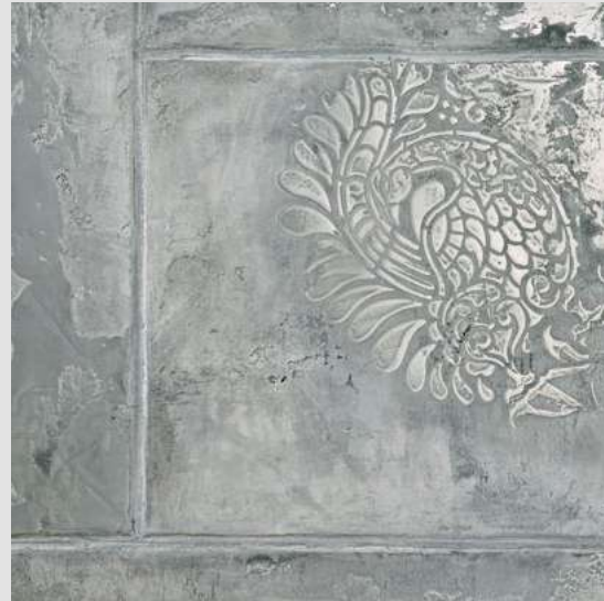
METALLO_FUSO & ARCHI+ CONCRETE